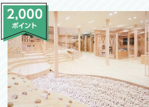
檜原村セット(2施設利用券)